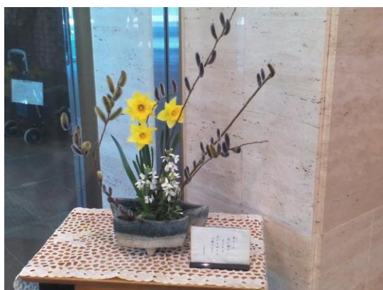
进得大门可以看到插花 这些花还经常更新